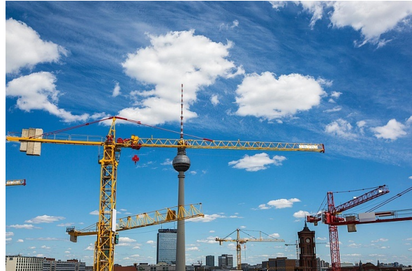
> Das Berliner „Schneller-Bauen-Gesetz“ ist in Kraft getreten