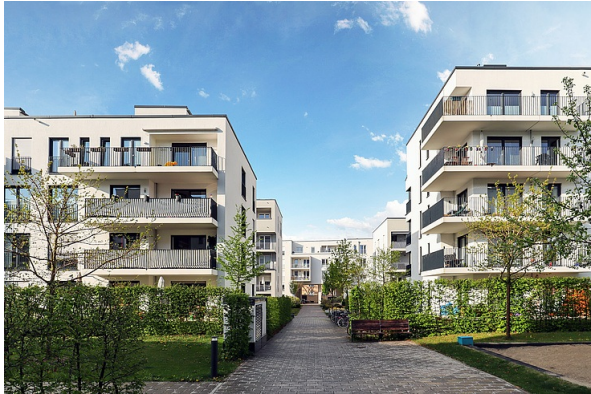
> Der „Wohnungsbau-Turbo“ ist in Kraft getreten