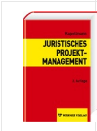
> Juristisches Projektmanagement