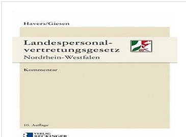
> Landespersonalvertretungsgesetz Nordrhein-Westfalen