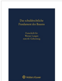
> Das schuldrechtliche Fundament des Bauens - Festschrift für Werner Langen zum 65. Geburtstag