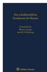
› Das schuldrechtliche Fundament des Bauens - Festschrift für Werner Langen zum 65. Geburtstag