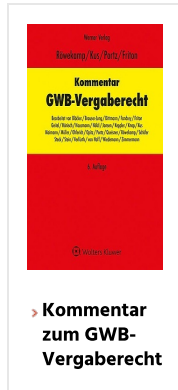
> Kommentar zum GWB-Vergaberecht