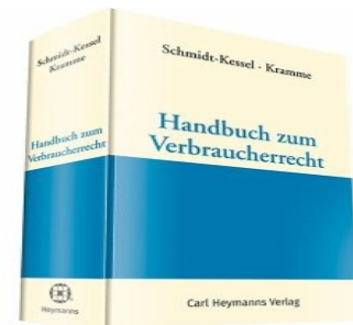
› Handbuch zum Verbraucherrecht