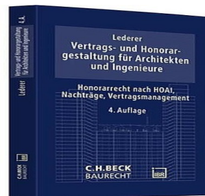
› Vertrags- und Honorargestaltung für Architekten und Ingenieure - Honorarrecht nach HOAI, Nachträge, Vertragsmanagement