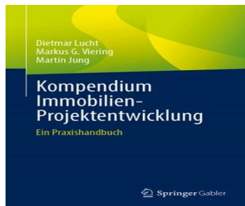
› Kompendium Immobilien-Projektentwicklung