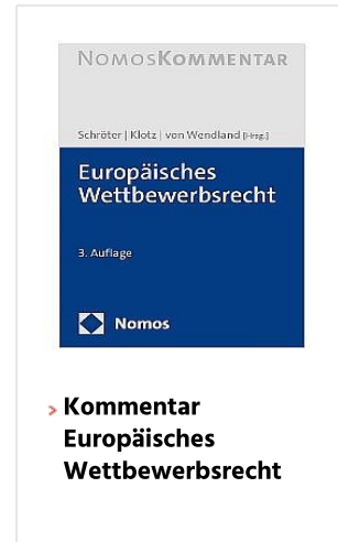
> Kommentar Europäisches Wettbewerbsrecht