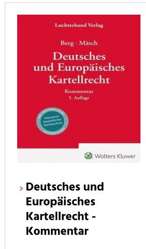
> Deutsches und Europäisches Kartellrecht - Kommentar