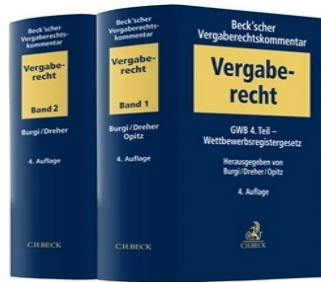
> Beck'scher Vergaberechtskommentar