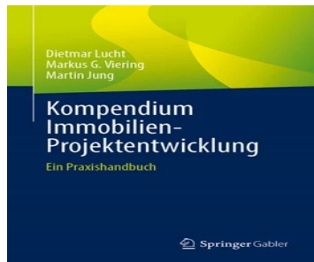
> Kompendium Immobilien-Projektentwicklung