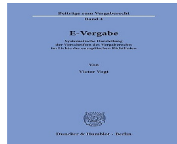
> E-Vergabe - Systematische Darstellung der Vorschriften des Vergaberechts im Lichte der europäischen Richtlinien